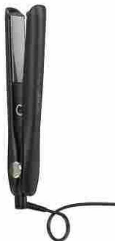
Hair look Aveda - ghd GOLD® STYLER