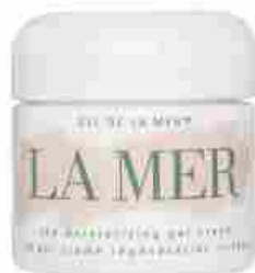
La Mer The Moisturizing Cool Gel Cream

Inoltre, proprio come facciamo con l'armadio, è importante fare un "cambio di stagione" dando un'occhiata alla scadenza dei cosmetici, concedendoci nuovi prodotti in grado di coccolare la nostra pelle alla frizzante aria primaverile.