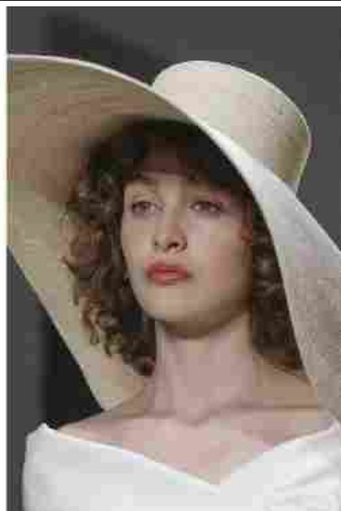
Chanel Rouge Coco Shine 138 Poppy Orange