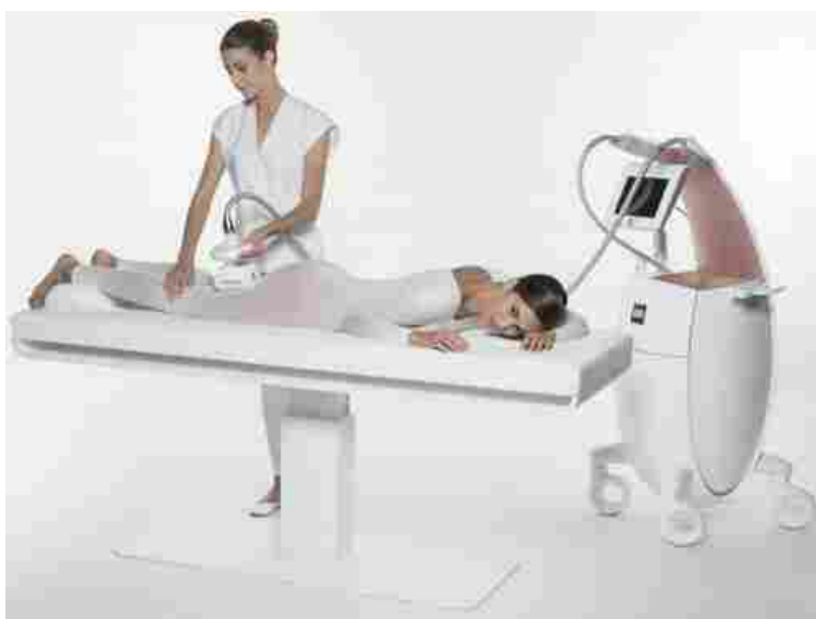
Trattamento LPG endermologie®

Il concept LPG è quello di promuovere una bellezza naturale in un contesto "healty" per un benessere che parte da dentro e si manifesta nei tratti del viso, così come nella nostra silhouette, con risultati visibili fin dalla prima seduta.