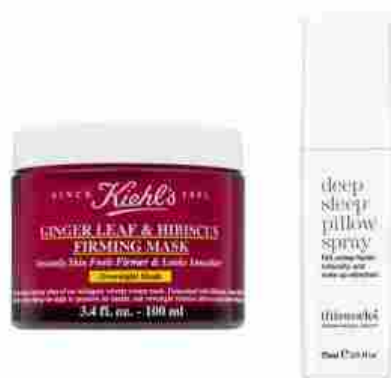
Kiehl's Ginger Leaf & Hibiscus Firming Mask - This Works Deep Sleep Pillow Spray

Per coadiuvare questo importante momento è necessario scegliere prodotti mirati, come un mist rilassante da vaporizzare sul cuscino e un'ottima maschera da notte, perfetta per nutrire e tonificare la pelle mentre dormiamo.