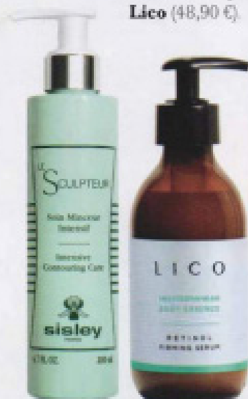
Le Sculpteur (190 €) reduce volumen en 14 días, de Sisley .