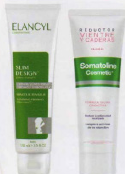
Criogel, reductor de vientre y caderas de Somatoline (39,90 €).