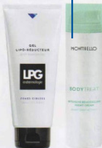
Intensive Remodelling Night Cream, crema reductora nocturna, de Montibello (47,30 €).