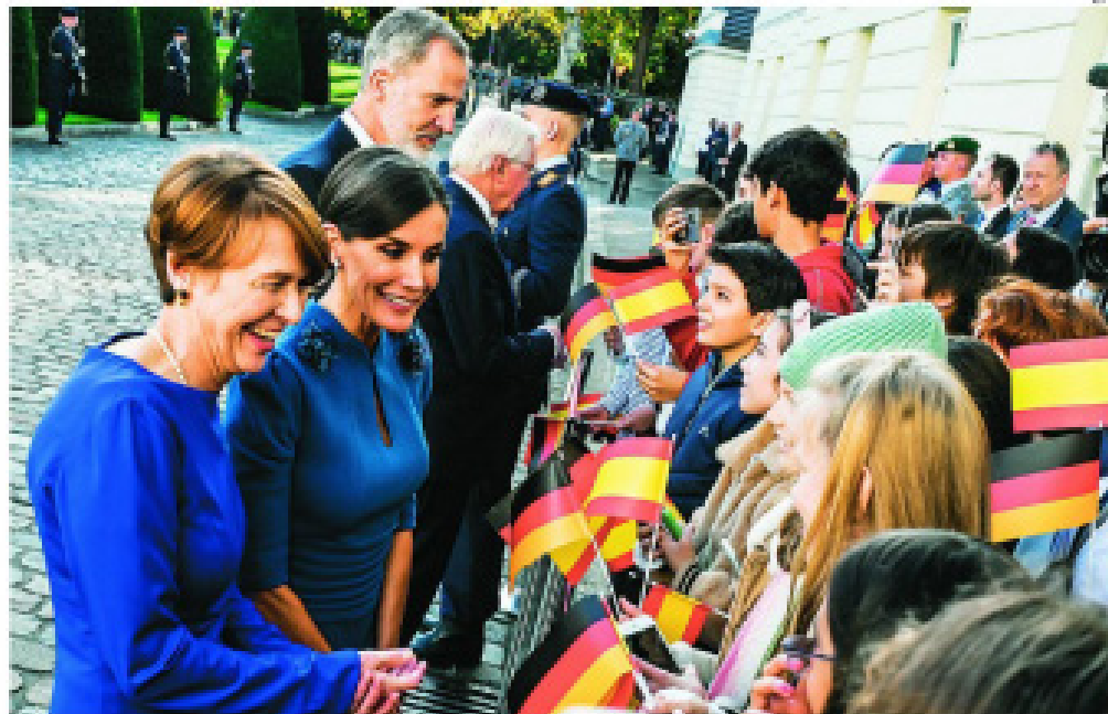
Los Reyes, junto a Frank-Walter Steinmeier y su esposa, firmaron autógrafos en banderines y coronas a un grupo de escolares

En su última oleada de ataques, Rusia utilizó docenas de drones suicidas iraníes. Al menos cuatro personas murieron en Kyiv ayer por la mañana después de que un edificio residencial en el centro de la ciudad fuera destruido. p. 18-19