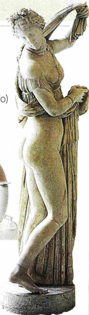
Classica Venere Callipigia, Museo Archeologico Nazionale di Napoli, solleva le vesti mostrando le sue forme sinuose