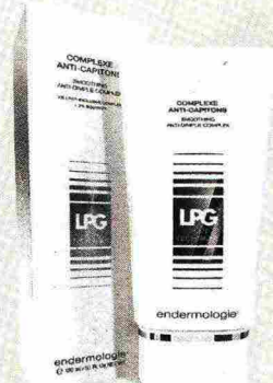
LPG Cellu M6 Alliance (foto grande) sfrutta l'effetto snellente dell'aspirazione sequenziale, con l'emulsione Complexe Anti-Capitons (foto)

ci. I trattamenti Endermologie agiscono direttamente sui processi fisiologici coinvolti quasi raddoppiando il destoccaggio naturale dei grassi sottocutanei».