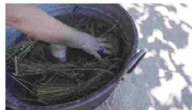
Fendi: il video che omaggia l'Italia e l'artigianallità